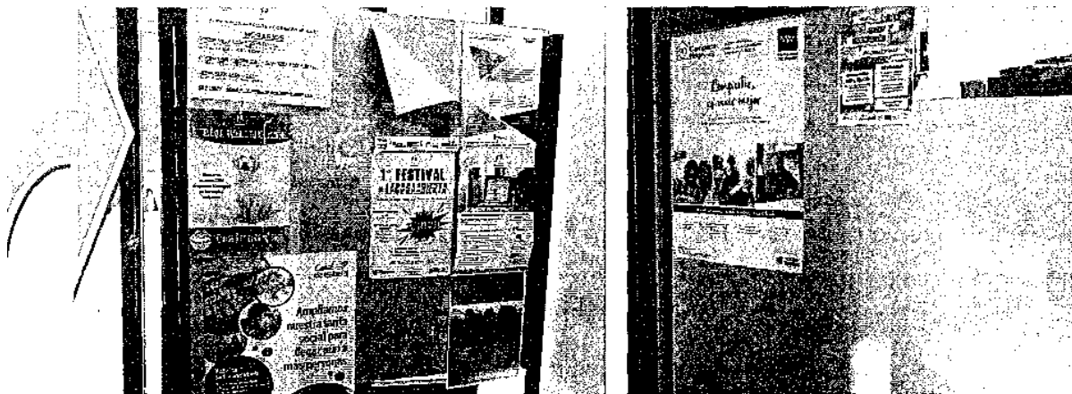
SITUACIÓN ACTUAL SIN APROVECHAMIENTO REAL