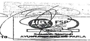
Calendario Laboral General del Ayuntamiento de Parla 2019